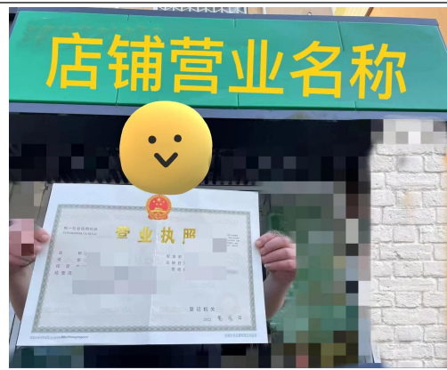
名称不符的，手持营业执照拍照示例